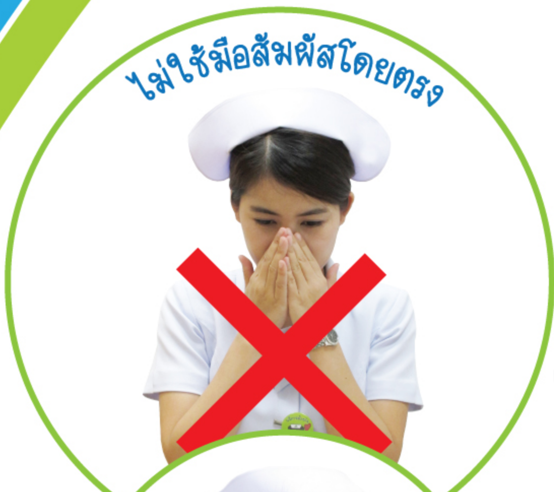
❌ ไม่ใช้มือสัมผัสโดยตรง