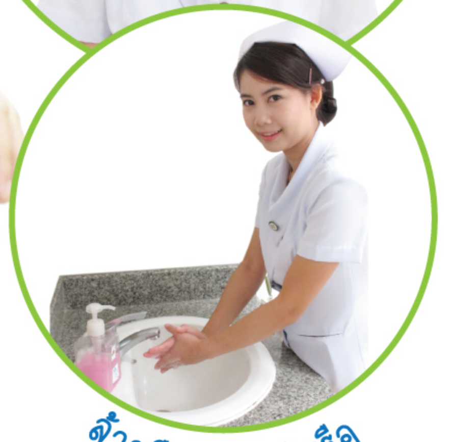
ล้างมือด้วยสบู่หรือ แอลกอฮอล์ฆ่าเชื้อ หลังไอ จาม ทุกครั้ง