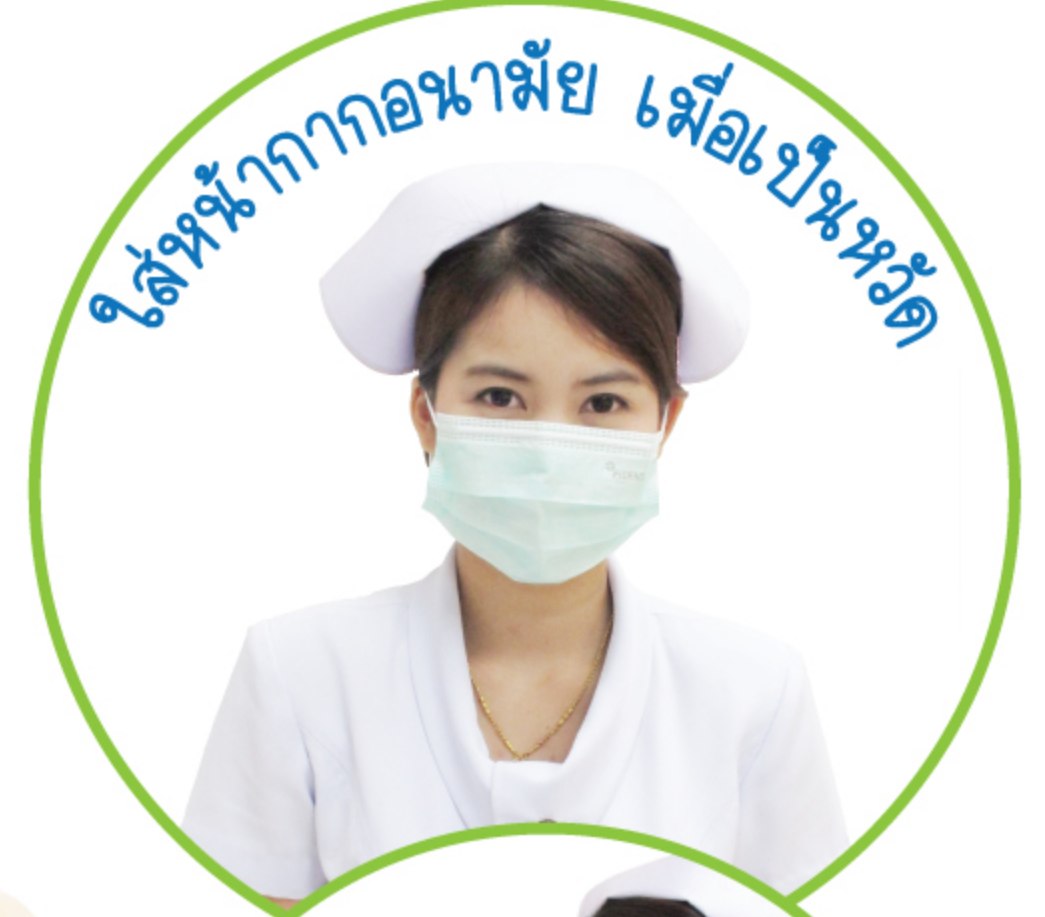
ใส่หน้ากากอนามัย เมื่อป่วยหรือ