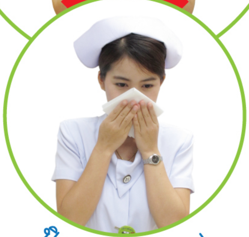
ปิดปากเมื่อไอ จาม ด้วยทิชชู / กระดาษชำระ แล้วทิ้งในถังขยะที่ปิดมิดชิด